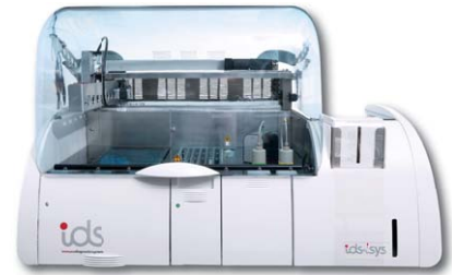
IDS-iSYS Multi-Discipline Automated System